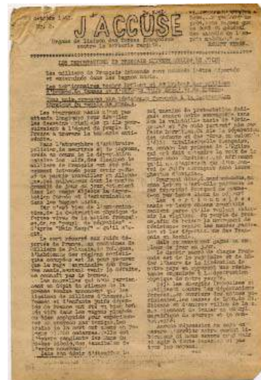
Avec cette feuille clandestine, le Mouvement National contre le Racisme mobilise l'opinion publique pour que se développe l'action des réseaux de sauvetage – octobre 1942

« Pour un enfant, au Noirvault, c' était la liberté. Je me promenais. J' accompagnais les vaches dans les champs. Le matin, c' était de grandes tartines de beurre salé. J' étais aimé par tout le village. »