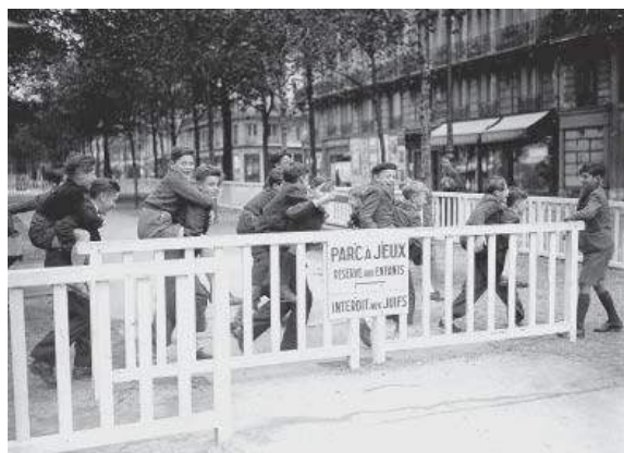
La 9 e ordonnance allemande interdit aux Juifs de fréquenter les lieux publics. Ici, à Paris, parc à jeux interdit aux Juifs – Novembre 1942

Les mesures d'exclusion se radicalisent jusqu'au printemps 1942 privant les Juifs des droits les plus élémentaires, les excluant de la vie économique et leur confisquant leurs biens privés. Le 2 nd statut juif promulgué par le régime de Vichy le 2 juin 1941 renforce l'exclusion économique. Désormais, les chefs de famille sont totalement exclus de la vie économique et mis au ban de la société. Pour assurer la subsistance quotidienne, le recours au travail clandestin et aux œuvres de bienfaisance juive est le lot commun. La 8 e ordonnance allemande du 29 mai 1942 impose en zone occupée le port de l'étoile jaune pour toute personne juive âgée de plus de 6 ans. La propagande antisémite désigne les Juifs ennemis de la société.