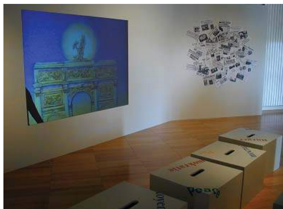
Exposition permanente Centre Régional « Résistance & Liberté »

Comprendre la construction et la finalité d'un film de propagande antisémite au service de l'idéologie nazie à partir des extraits du film Le Péril Juif .